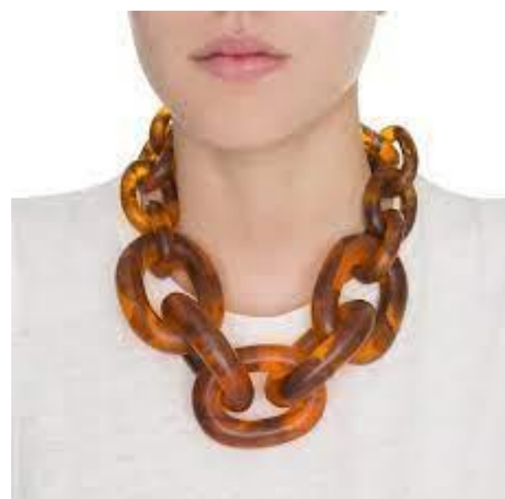
Figura 01 – colar

Os métodos utilizados foram de pesquisas secundárias, através de revistas e sites, neles foram pesquisados acessórios de forma segmentada a nível de Paraná e a nível de Brasil, sendo constatado no início da pandemia uma grande queda nas vendas.