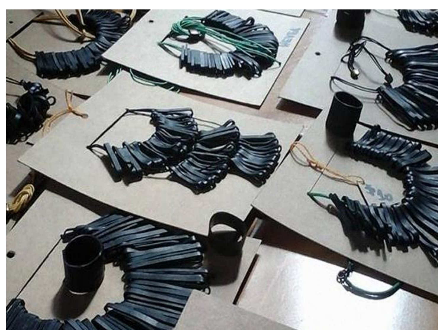
Figura 3: colares de pneu