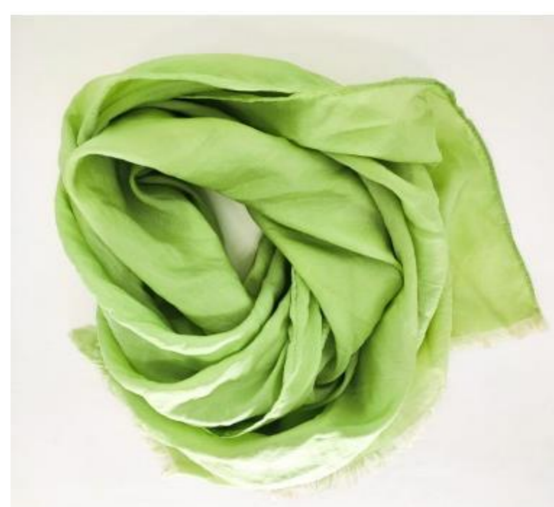
Figura 2: cachecol de seda de casulos desprezados para exportação