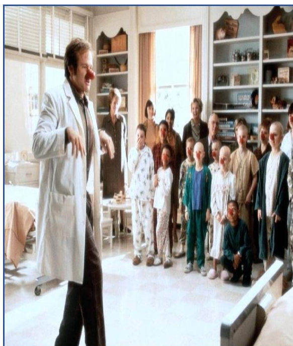
Fonte: Cena do Filme Patch Adams

Patch Adams descobre que o humor e o carinho podem fazer maravilhas e ajudar a curar pessoas hospitalizadas, mas suas ideias entram em conflito com os defensores da medicina tradicional.